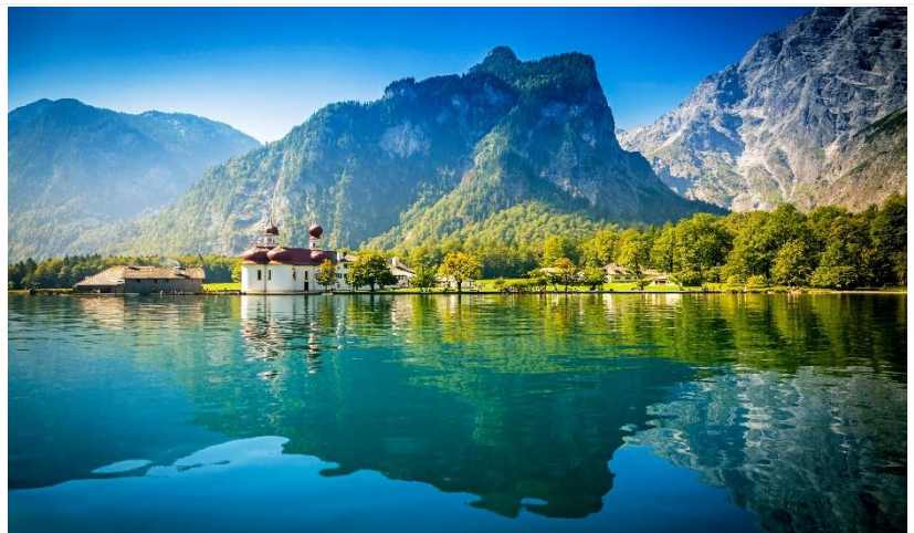
尋訪德國綠寶石 | 國王湖

位於德國與奧地利邊界的國王湖，因其純淨碧綠的水質而聞名天下。湖水清澈翠綠，四面環繞陡峭高聳的山壁瓦茲曼峰、石海、哈根山脈，是東阿爾卑斯山最美的珍珠。