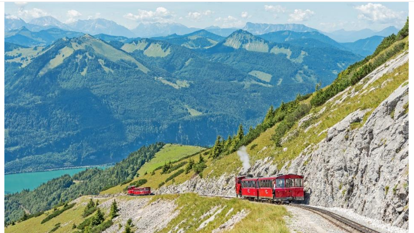
湖區探秘 百年登山小火車