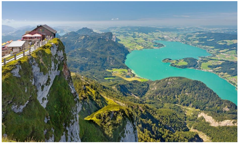
湖區探秘 一覽奧地利7大湖

唯一能一口氣看到7大湖區的地方就在這裡！搭著登山火車慢慢攀上山，天氣晴朗時環顧四週可以看見湖區7個湖泊及100多座山峰的絕美風景。