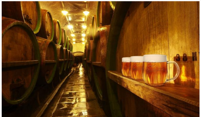
品味第一名啤酒 | 皮爾森釀酒廠

1842 年皮爾森啤酒廠釀製出第一杯皮爾森啤酒，之後這裡就成為啤酒釀製的知名城市及技術中心，並生產捷克銷售量最高的啤酒。在這裡您可以參觀到地下啤酒窖裡的釀製過程，還有過去珍貴照片的釀酒歷史紀錄，參觀終了還能品上一杯新鮮的黃金啤酒。