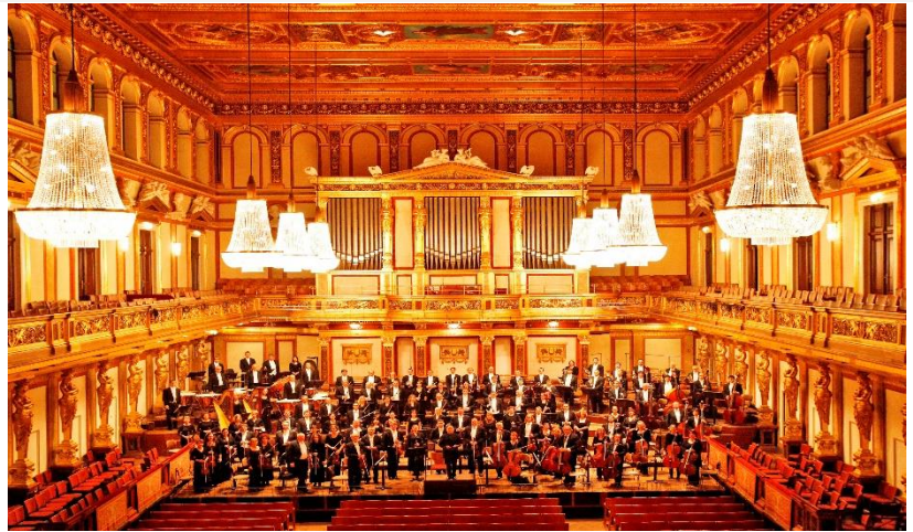
淺嚐古典音樂 | 金色大廳音樂會

音樂廳與咖啡館同樣體現維也納生活焦點，是在地文化的重要展現。特別安排金色大廳享受浪漫古典交響樂，在音樂聲中渡過一個難忘的奧地利—維也納之夜。