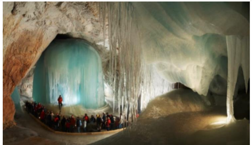
探秘最大冰洞 維爾芬冰洞

維爾芬冰洞德文稱為「冰巨人的世界」，內部延伸超過42KM。是全世界最大的冰洞，由薩爾扎赫河流經山脈，經過數千年侵蝕而成。